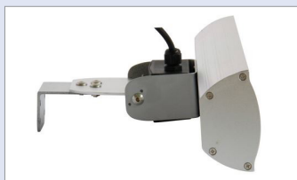
Kit di fissaggio