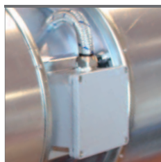
Scatola morsettiera IP54 resistente all'alta temperatura.