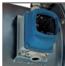
Interruttore di servizio IP67, certificato per alte temperature.